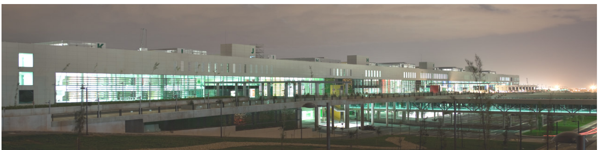
VISTA NOCTUNA ALZADO OESTE