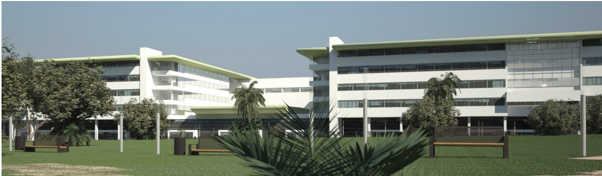
ACCESO AL AREA DE HOSPITALIZACION