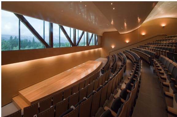
SALÓN DE ACTOS