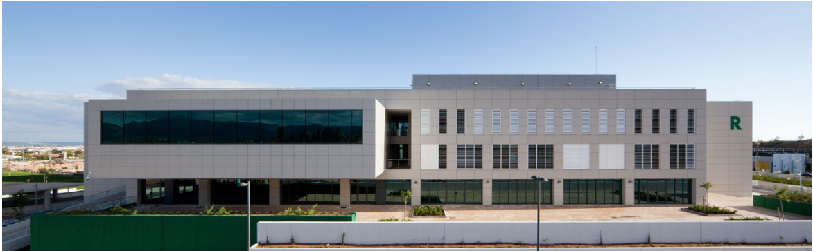
ALZADO NORTE DEL HOSPITAL EN EL QUE SE APRECIA EL NUCLEO DEL SALON DE ACTOS Y CAFETERIA