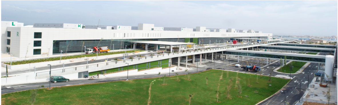
ALZADO OESTE DEL NUEVO HOSPITAL EN EL QUE SE APRECIAN LOS ACCESOS A URGENCIAS Y CONSULTAS