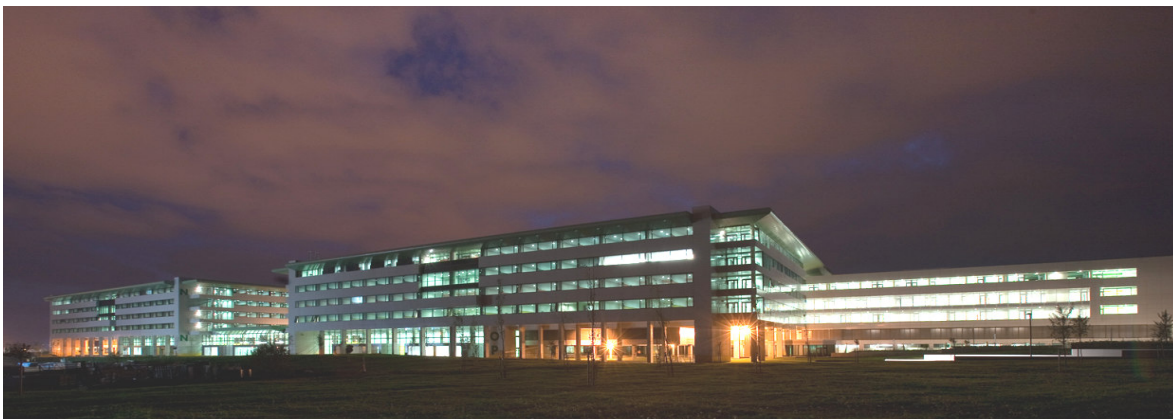
VISTA NOCTURNA AREA DE HOSPITALIZACION