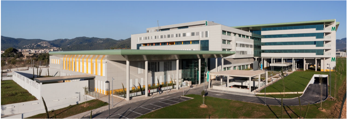
ALZADO SUR DEL HOSPITAL EN EL QUE SE APRECIA EL AREA DE PSIQUIATRIA Y HOSPITALIZACIÓN