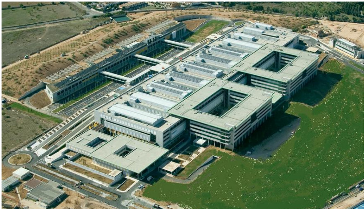
VISTA AEREA DEL ESTADO FINAL DE LAS OBRAS