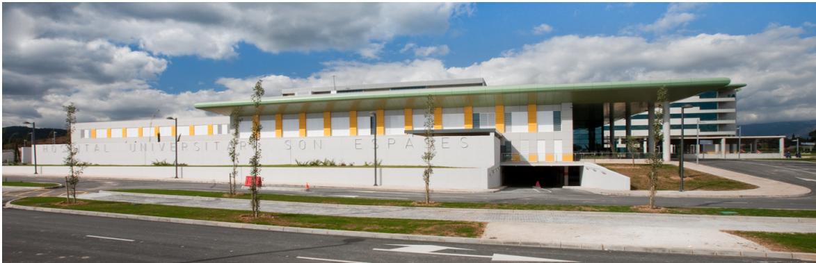
ALZADO SUR DESDE NÚCLEO DE PSIQUIATRIA