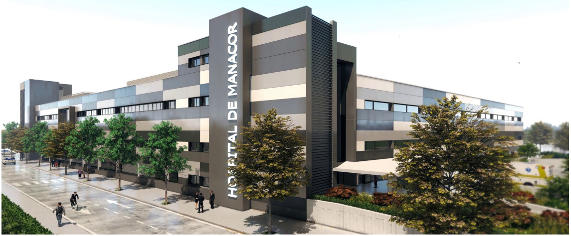
FACHADA DEL NUEVO EDIFICIO DE CONSULTAS EXTERNAS.