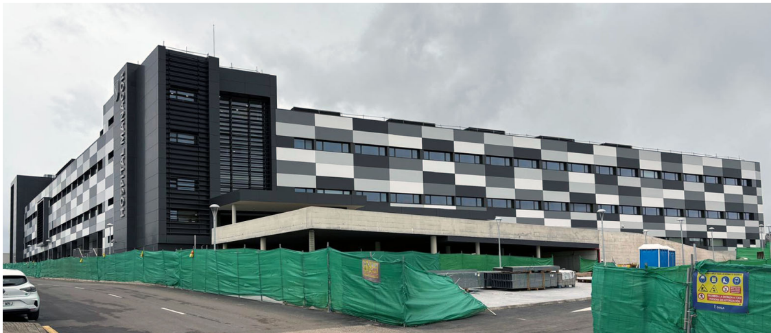
Estado de las Obras Enero 2026