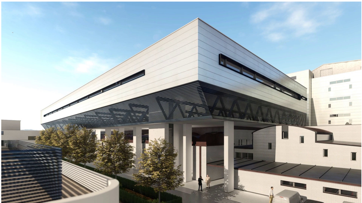
NUEVO VOLUMEN PARA ALBERGAR EL BLOQUE QUIRÚRGICO.