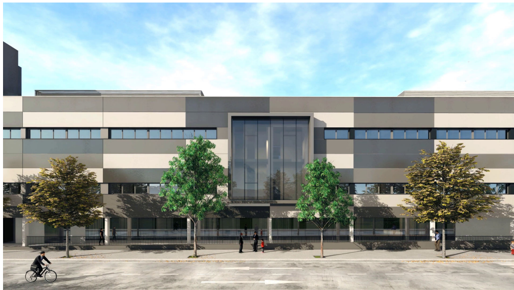
FACHADA EFICIO DEL NUEVO EDIFICIO DE CONSULTAS EXTERNAS.