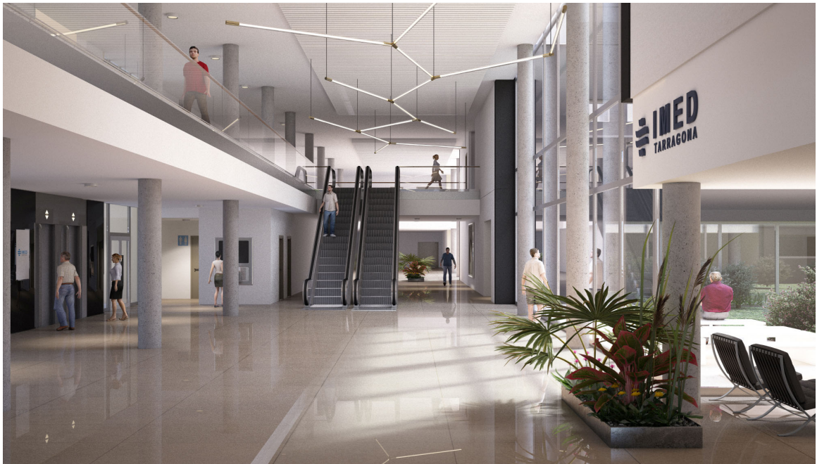
VESTÍBULO PÚBLICO / ATRIO