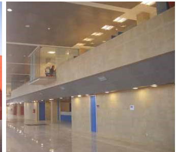
ENTRADA DE URGENCIAS Y NÚCLEO PRINCIPAL DE COMUNICACIÓN