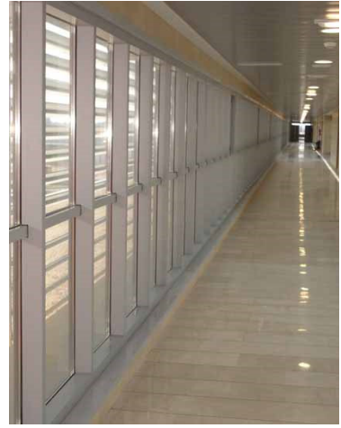
GALERIA DE CCEE.