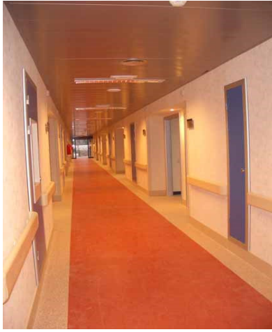
PASILLO DE COMUNICACIÓN