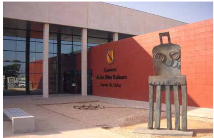
VISTA EN LA QUE SE APRECIAN LAS DISTINTAS FACHADAS QUE FORMAN EL HOSPITAL