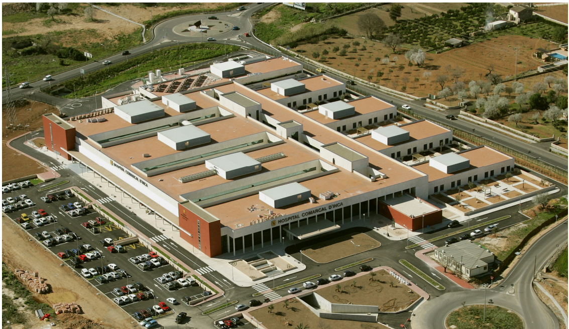
VISTA DE CONJUNTO DEL NUEVO HOSPITAL COMARCAL DE INCA