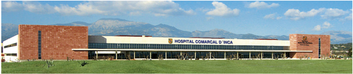
ACCESO PRINCIPAL AL NUEVO HOSPITAL COMARCAL D'INCA